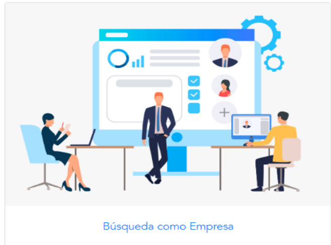
Búsqueda como Empresa

Ministerio de Trabajo y Desarrollo Laboral - Mitradel © 2020