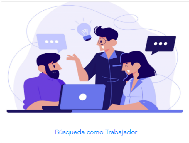
Búsqueda como Trabajador